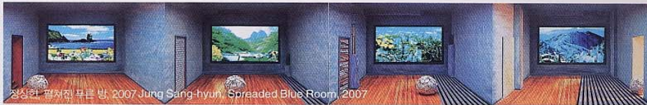
정신환 필러진 푸른 방, 2007 Jung Sang-hyun, 'Spreaded Blue Room', 2007

A rt Chicago is one of the world's three biggest art fairs, along with Art Basel, in Switzerland, and FIAC in France. Art Chicago is slated to take place in downtown Chicago this year. The influence that Art Chicago has on the art world is considerable, so much so that the value of artists and artwork featured in the fair go up. More than 2,000 artists from 180 galleries in 56 nations across the globe – who have undergone a rigorous selection process – will stir up enough artistic passion to make the US$20 admission feel worth it. This year's special exhibition is called "New Insight" and features the works of 24 graduates of 12 art programs. Immerse yourself in the works of young people who have just entered the art world. The art fair will take place from April 25 to 28. For more information see www.artchicago.com